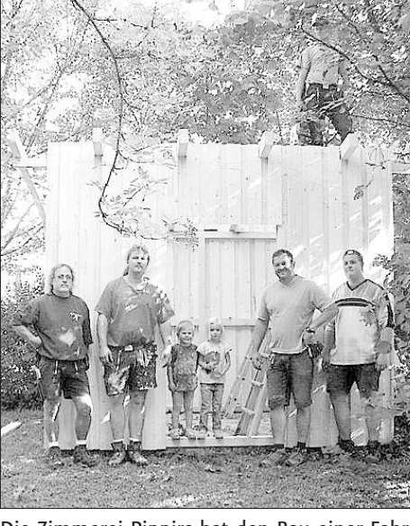
Die Zimmerei Pippirs hat den Bau einer Fahrzeughütte im Kiga Wirbelwind in Spraitbach tatkräftig unterstützt.

Bei einem Hüttenfest wurde diese Fahrzeughütte vor Kurzem eingeweiht. Die Kinder mit ihren Erzieherinnen umrahmten dieses Fest mit Liedern und Tänzen.