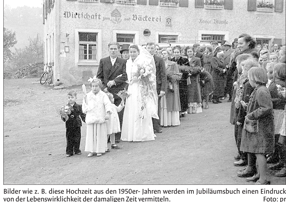
Bilder wie z. B. diese Hochzeit aus den 1950er-Jahren werden im Jubiläumsbuch einen Eindruck von der Lebenswirklichkeit der damaligen Zeit vermitteln.

Die Einsendung der Fotos sollte bis spätestens 19. September an das Landratsamt Ostalbkreis, Stefan Jenninger, Geschäftsbereich Personal und Organisation, erfolgen. Als kleines Dankeschön erhält jeder Einsender, dessen Foto abgedruckt wird, ein kostenloses Exemplar des Jubiläumsbuches.